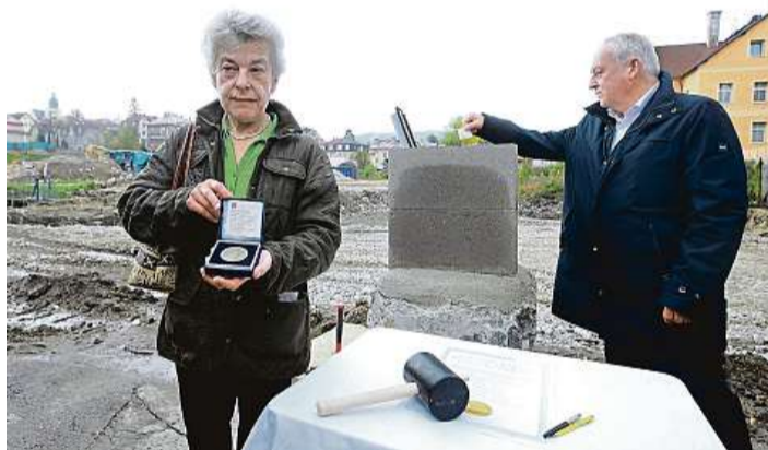
Budova Skloexportu v Liberci je léta bez využití.

Zástupci developerských společností, které za projektem stojí, představují Zahradu Gallas jako způsob udržitelného bydlení. „Věříme, že z projektu Zahrada Gallas vznikne živá komunita, nechceme postavit anonymní sídliště. Proto domy obklopí zahrady pro odpočinek místních obyvatel, kteří v okolí