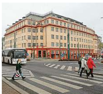
Budova Skloexportu v Liberci je léta bez využití.

Stát se neúspěšně pokouší areál o podlahové ploše 9357 metrů čtverečních prodat od roku 2008. Podle odhadů potřebuje rekonstrukci za více než půl miliardy korun. Budova léta patřila generálnímu finančnímu ředitelství. Poprvé ob-